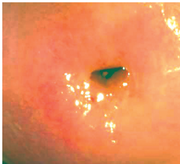
Кольпоскопічна картина шийки матки пацієнтки II групи до лікування – ділянка мозаїки (ліворуч) та після лікування – відсутність атипових змін (праворуч)