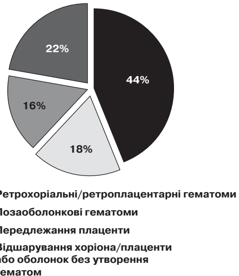
Мал. 2. Результати ультразвукового дослідження у групі порівняння (n=50)

Отже, встановлено, що препарат транексамової кислоти у дозах від 1000 мг до 1500 мг на добу за тривалості курсу ліку-