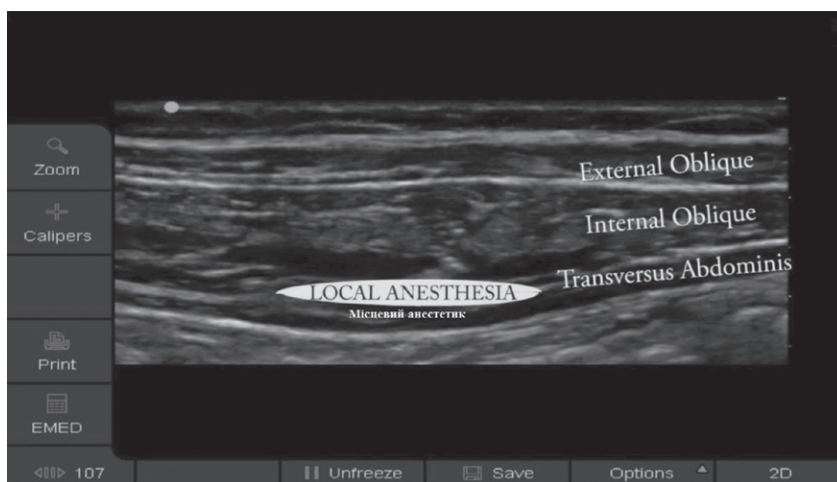
Мал. 3. Проведення ТАР-блоку під контролем УЗД

Щоб провести блок безпечно, необхідно використовувати УЗД-контроль [33]. Таке використання місцевих анестетиків зменшує застосування знеболювальних препаратів у післяопе-