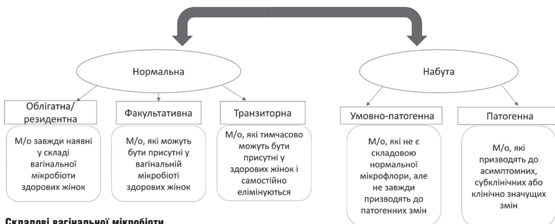
Мал. 2. Складові вагінальної мікробіоти

жінки пред'являють скарги на дискомфорт, викликаний вагінальними виділеннями [1, 2, 3].